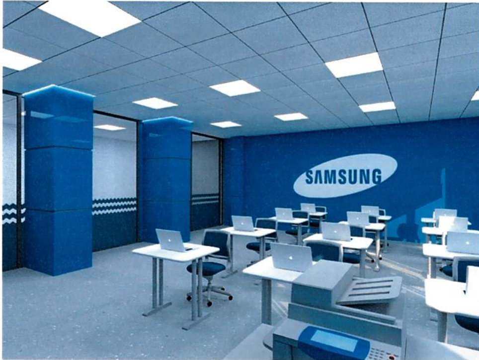
Рис.5. Дизайн-проект: Куб "Мобильные разработки", вид 2.

3) Проект зонирования кабинета "Программирование на Python", "Основы программирования на Java"