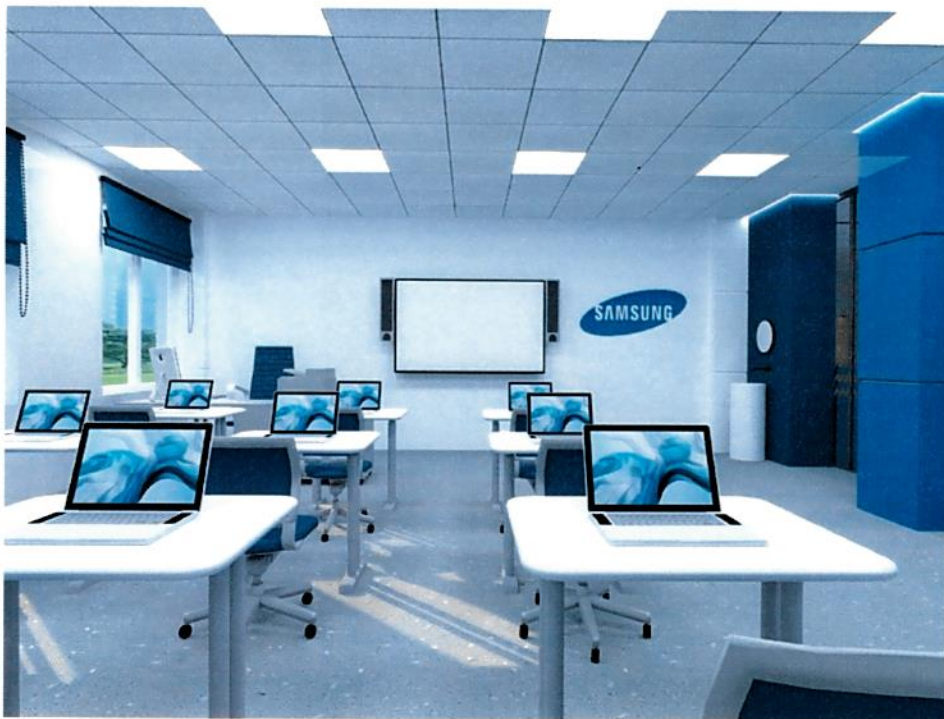
Рис.4. Дизайн-проект: Куб "Мобильные разработки", вид 1.