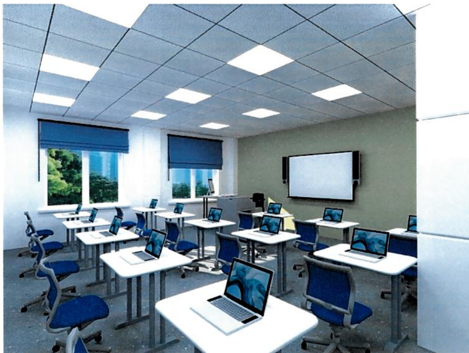
Рис.8. Дизайн-проект: Куб "Кибергигиена и работа с большими данными".

4) Проект зонирования кабинета "Кибергигиена и работа с большими данными".