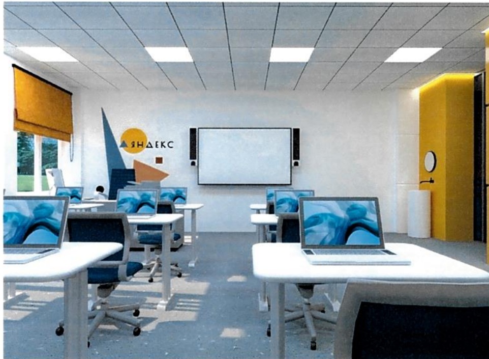
Рис.6. Дизайн-проект: Куб "Программирование на Python"/"Основы программирования на Java", вид 1.

3) Проект зонирования кабинета "Программирование на Python", "Основы программирования на Java"