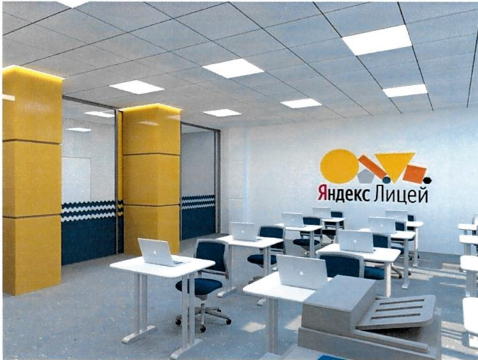
Рис.7. Дизайн-проект: Куб "Программирование на Python"/"Основы программирования на Java", вид 2.

4) Проект зонирования кабинета "Кибергигиена и работа с большими данными".