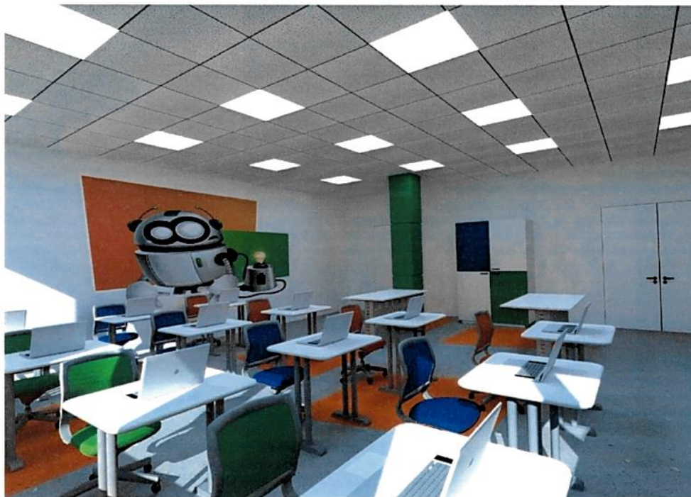
Рис.10. Дизайн-проект: Куб "Программирование роботов"/"Лекторий", вид 2.