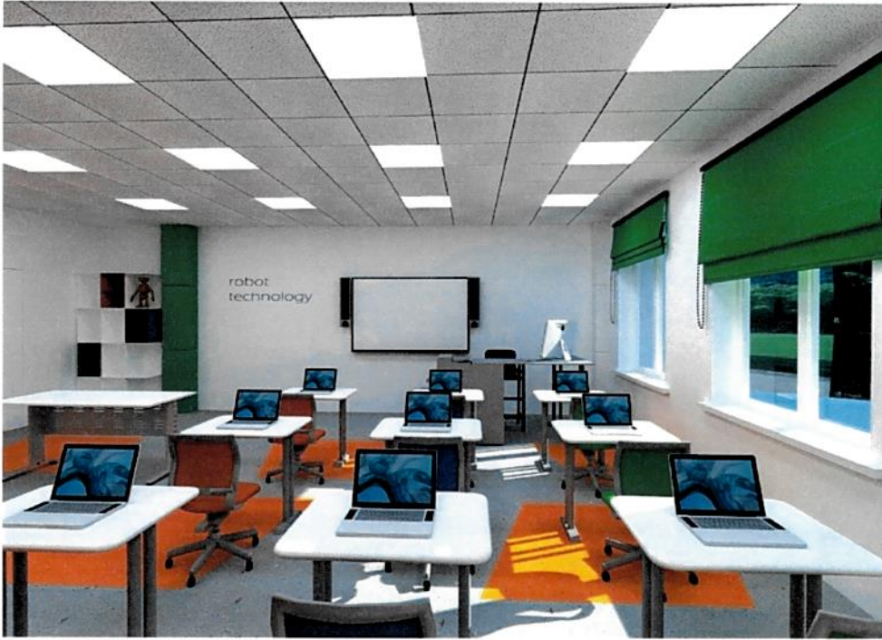
Рис.9. Дизайн-проект: Куб "Программирование роботов"/"Лекторий", вид 1.