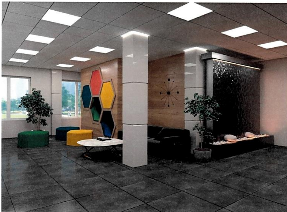
Рис.11. Дизайн-проект: Зона отдыха/Коворкинг/Шахматная гостиная, вид 1.

б) Проект зонирования коворкинг зоны, шахматной гостиной и других функциональных зон.