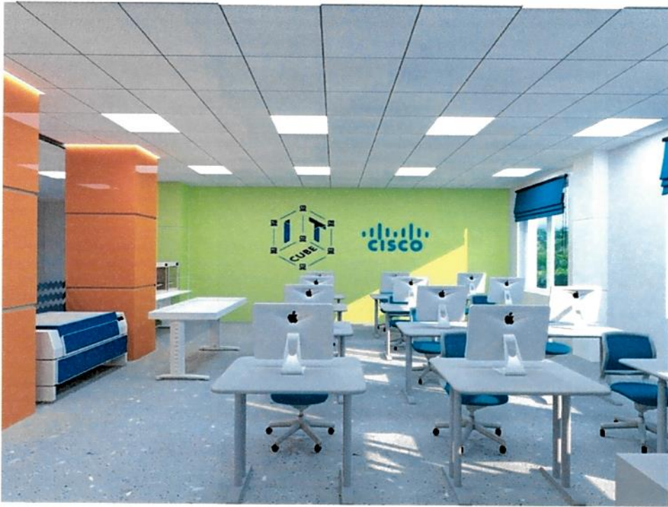
Рис.3. Дизайн-проект: Куб "Системное администрирование", вид 2.